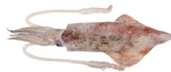
cod. 661002 Calamar Nacional 2-P 4x 5Kg