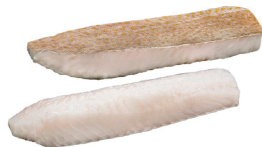
Lomo Bacalao cod. 664545 .... Jumbo +1.000g 5Kg cod. 664553 .... Colosal +900g 5Kg