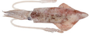
cod. 661000 Calamar Nacional 1-P 4x 5Kg