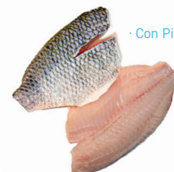
cod. 664054 Tilapia Filete 5Kg