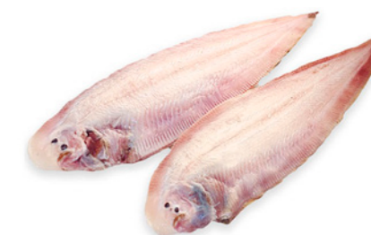
Lengua Pelada cod. 664016 ..... 600-800g 10Kg cod. 664015 ..... 400-600g 10Kg