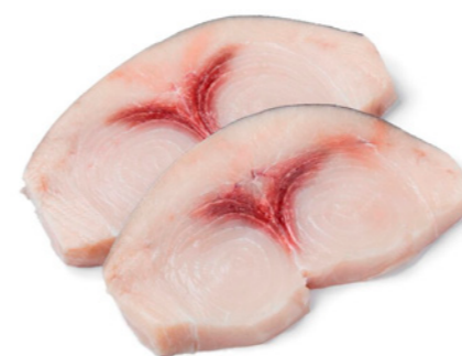
cod. 664403 Emperador Rodajas Extra 12Kg