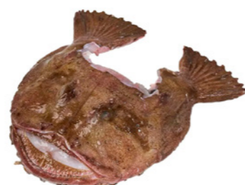
cod. 664092 Cabezas Rape Troceadas 8Kg