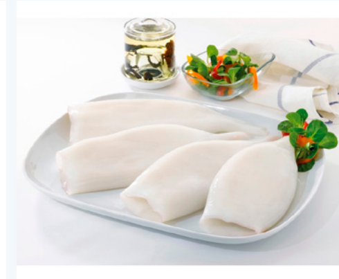
cod. 661071 Tube Pota Armario G 20-23cm | Argentina | 7Kg