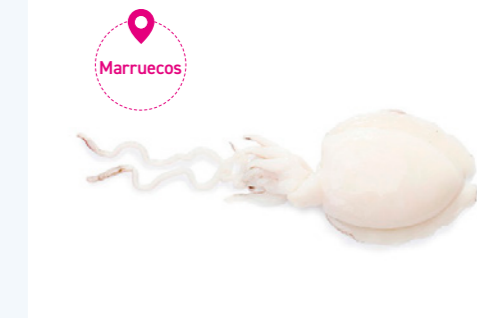
cod. 661120 Sepia Limpia 200-300g | Marruecos | 5Kg