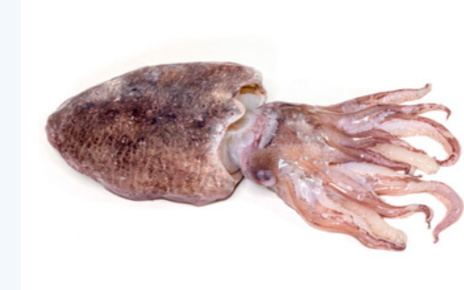
Sepia Sucia K-7 cod. 661104 . . . . . K6 200-300g 5Kg cod. 661105 . . . . . K7 150-200g 7Kg