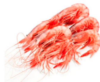
cod. 662201 Gamba Alistada A1 38/40 1Kg