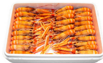
cod. 662102 Cigalas N°2 16/20 1,5Kg