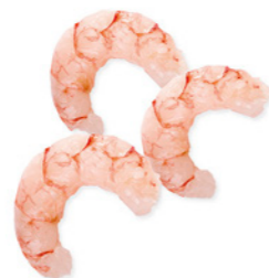
cod. 662279 Cola Langostino Black Tiger Argentino Pelado 10/20 1Kg