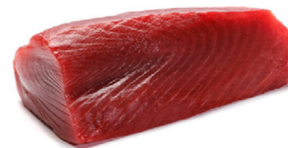
cod. 668148 Lomo Atún Extra 4Kg