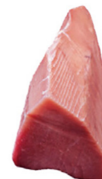
cod. 664406 Lomo Atún S/S 4x 3,5Kg