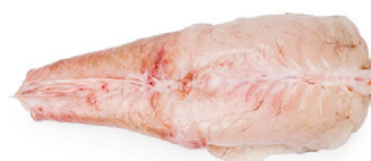
cod. 664102 Cola Rape 1.800-2.000g Caja de 22Kg