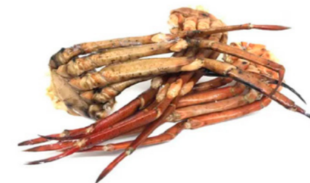
cod. 662415 Cuerpo Cangrejo CH N°3 2Kg