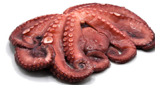
Pulpo cod. 661199 . . . . . T1 +4Kg cod. 661200 . . . . . T8 300-500g 7Kg cod. 661201 . . . . . Bandeja 4-6Kg