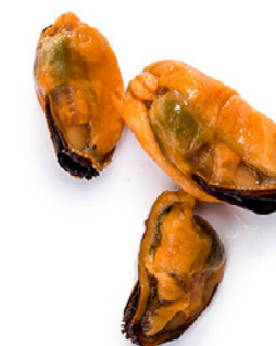
Mejillón Sin Concha cod. 663006 ..... 200/300 10Kg cod. 663008 ..... 100/200 1Kg