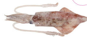
cod. 661023 Calamar 200-300 10Kg