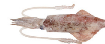
cod. 661004 Calamar Nacional 1-P 4x 5Kg