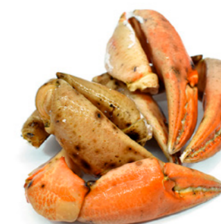
cod. 662402 Bocas Cangrejo M 4Kg