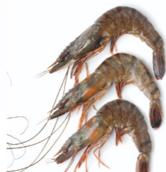
Langostino Black Tiger cod. 662309 ..... 13/15 1Kg cod. 662307 ..... 16/20 1Kg