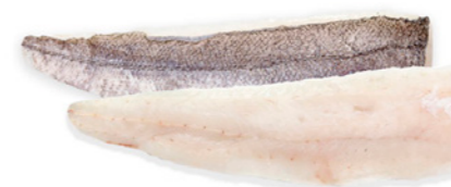
cod. 664248 Filete Merluza Nacional 170-220g 5Kg