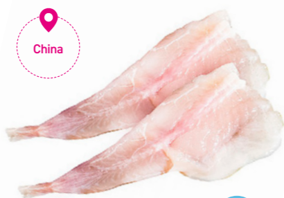
Cola Rape cod. 664125 .... 200-300g 1Kg cod. 664126 .... 150-200g 1Kg