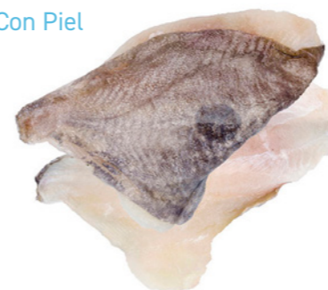
Filete Gallo de San Pedro cod. 664541 ..... 300-500g 5Kg cod. 664537 ..... +200g 5Kg