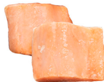
cod. 664256 Salmón Lomo Porción 80-120g 6Kg