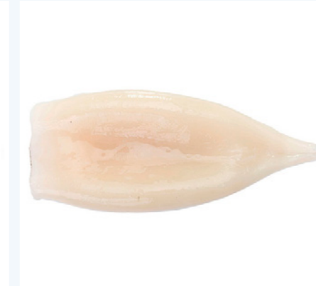
cod. 661064 Tube Pota Illex +20cm | 5Kg