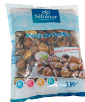
cod. 663106 Almeja Entera Marrón 40/60 1Kg