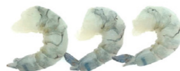
Cola Langostino Black Tiger cod. 662361 ..... 13/15 1Kg cod. 662362 ..... 16/20 1Kg