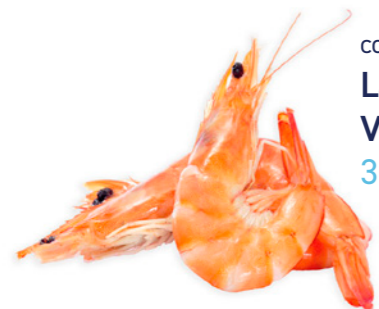
cod. 662255 Langostino Vannamei Cocido 30/40 1Kg