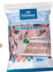
cod. 661026 Puntilla de Calamar Silomar 6x 1Kg