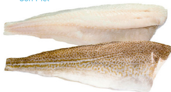
cod. 664563 Filete Bacalao +1000g 11Kg