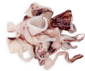
cod. 662020 Calamar Indio Troceado 6x 1Kg