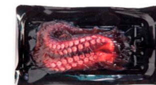
cod. 661219 Tentáculo Pulpo Cocido 200-250g | Pack 2 4Kg