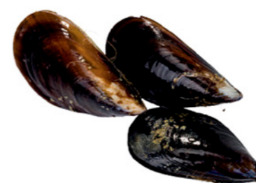
cod. 663001 Mejillón Cocido Jugosón 10Kg