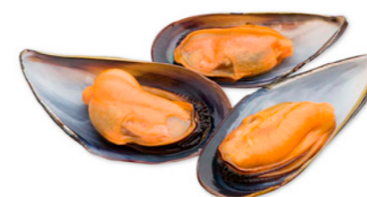
cod. 663004 Mejillón Media Concha 7Kg