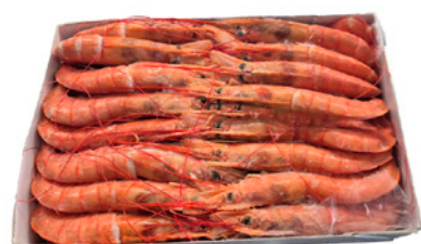
Langostino Argentino cod. 662277 ..... L1 10/20 2Kg cod. 662281 ..... L2 20/30 2Kg