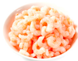
Gamba Pelada Cruda cod. 662228 ..... 10/30 1Kg cod. 662229 ..... 30/50 1Kg