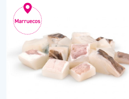
cod. 671995 Dados de Sepia Con Piel | 8Kg "Ideal para sopas, paellas y fideuá"