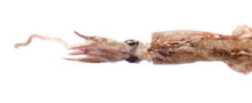
cod. 661022 Calamar Patagónico C-4 4x 5Kg