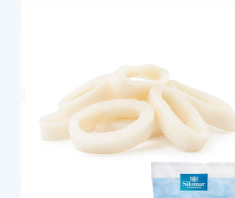
cod. 661062 Anillas de Potas 5Kg